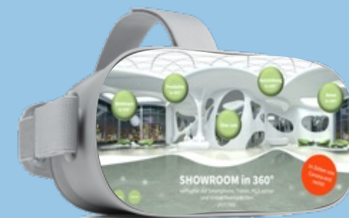
Virtual Reality Brille