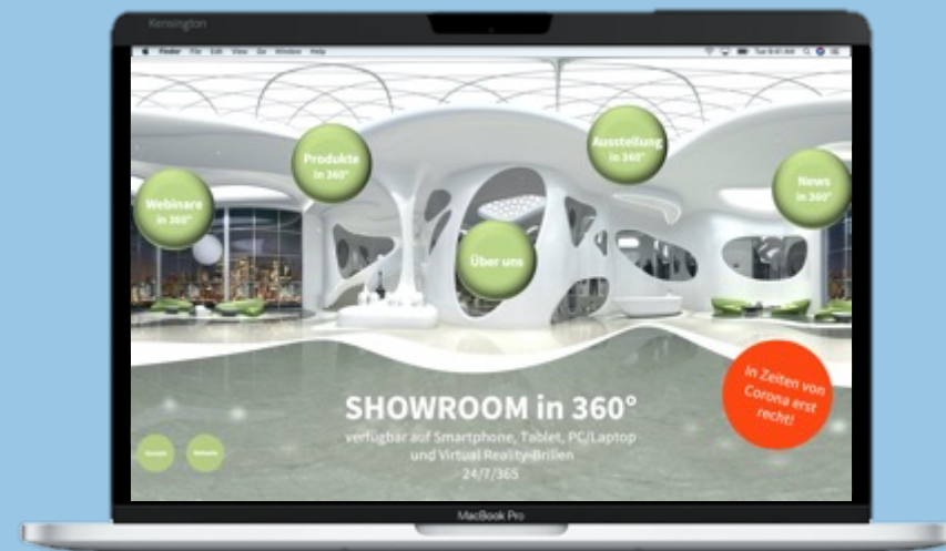
PC / Laptop und auf der eigenen Webseite